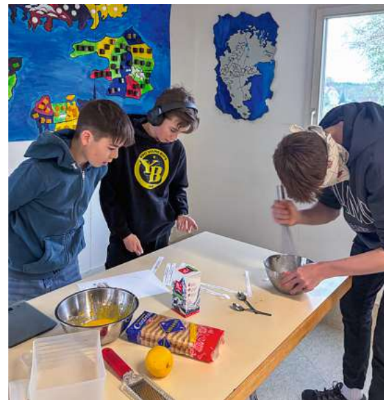
Gruppenstunde – auch die Backkünste, hier mit Einschränkungen, müssen erprobt werden.