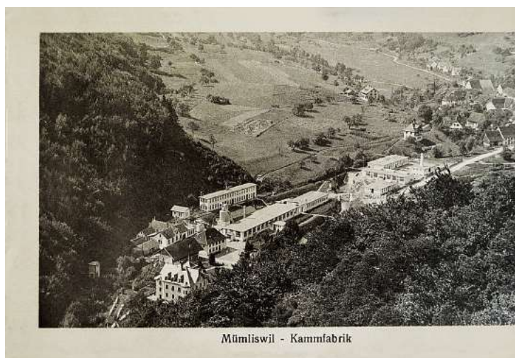
Mümliswil - Kammfabrik