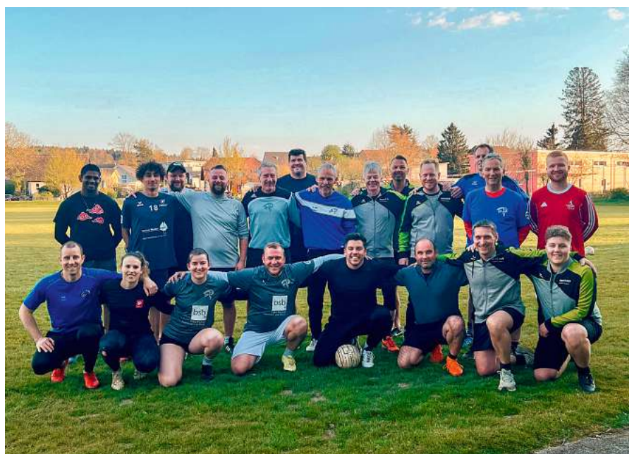
BSZ-Training mit Niederbuchsiten.