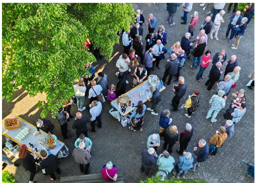
Beim anschliessenden Apéro auf dem Dorfplatz durften wir bei leckeren Köstlichkeiten mit den vielen Gästen auf ein wundervolles Konzert anstossen.