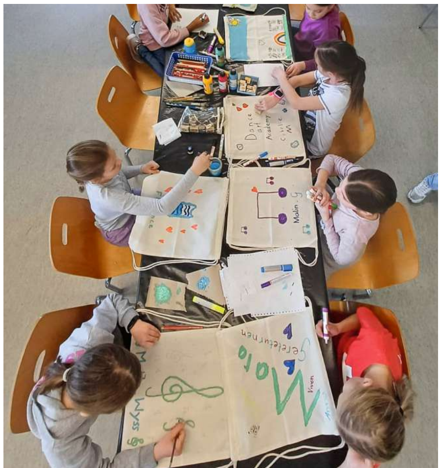
Gruppenstunde – Kreativität darf auch nicht zu kurz kommen.