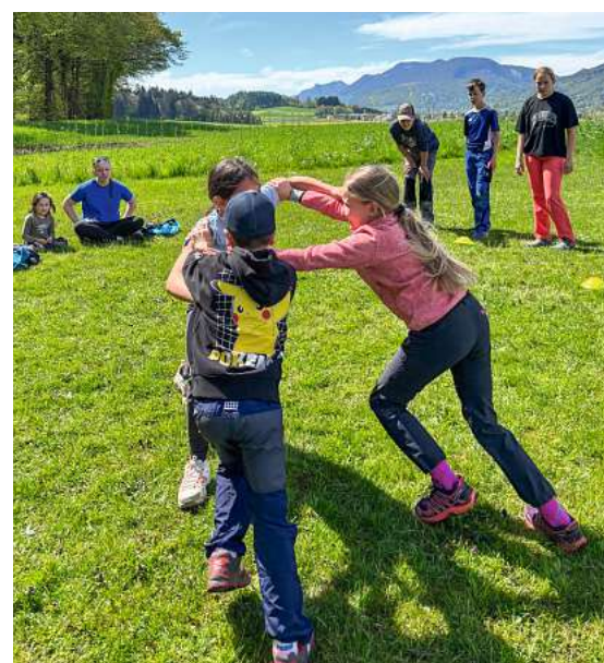
Frühlingscharanlass – wer wohl stärker war?

Gerne könnt ihr auch auf Instagram (@jublaneuendorf), auf Facebook (Jubla Neuendorf) oder natürlich auf unserer Homepage (www.jubla-neuendorf.ch) weitere Einblicke in unser Jubla-Leben erhaschen. Mer fröie öis!