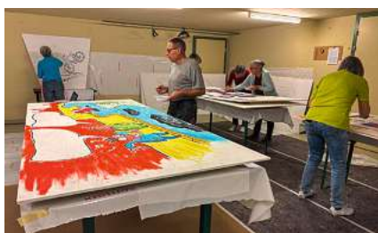
Im Maleratelier wird getextet, gezeichnet und gemalt, was das Zeug hält.

Um Punkt 13.30 Uhr setzte sich der Umzugstross in Bewegung. Die als Strassenarbeiter gekleideten Chropftuube Senioren begeisterten die Menschenmenge mit der riesigen Brücke und supponierten Strassenbau-Arbeiten. Mit Muskelkraft wurde das schwere Gefährt auf der holprigen Dorfstrasse durch die beidseits der Dorfstrasse applaudierenden Zuschauer/innen geschoben.