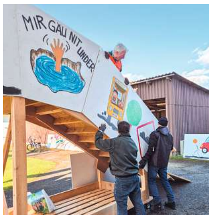
Auch diese Bildtafel passt.