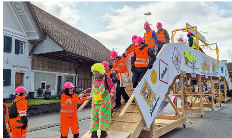
Die Brücke hat der Belastung standgehalten, es kann losgehen.

Alle waren begeistert und staunten ob der Dimension des Gefährts und der ideenreichen Umsetzung des Sujets. Mehrmals nutzten Klein und Gross die Gelegenheit für einen Marsch über die Brücke, um das fasnächtliche Treiben von oben zu geniessen. Derweil sich der Bautrup, instruiert vom Baubüro, supponiert Reparaturen an der löchrigen Strasse vornahm. Zur Stärkung wurden von der Kantine Gebackenes und Flüssiges an die Umzugsbesucher/innen verteilt.