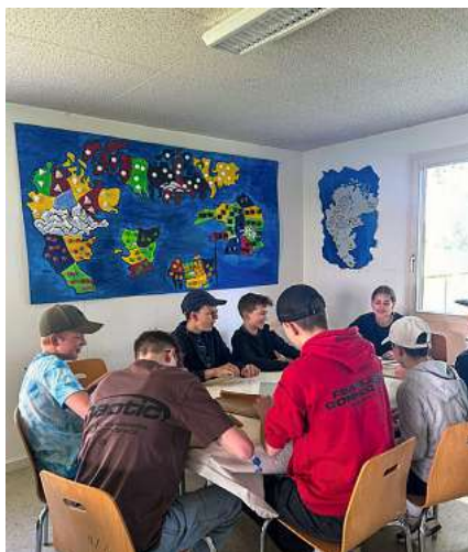
Kuchenverkauf – die Vorbereitungen laufen.

unternehmen wir die verschiedensten Aktivitäten miteinander. Die Jüngsten konnten so etwa ihre Kreativität beim Basteln ausleben. Die Ältesten hingegen vergnügten sich bei einem gemeinsamen Casinoabend. Bei den anderen Gruppenstunden ging es spielerisch zu und her. So kamen einige Jublakinder unter anderem in den Genuss einer Schnitzeljagd.