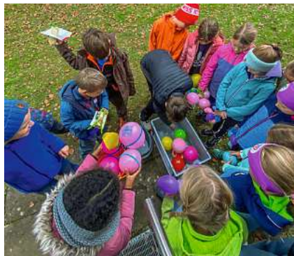
Gruppenstunde – kunterbunter Spass.