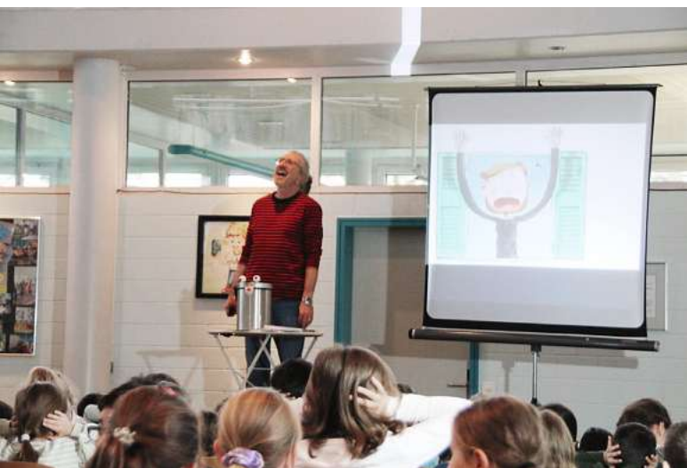
Fips hört ein Pieps.