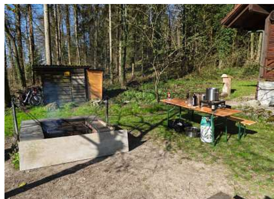
Küche Waldtag 2025