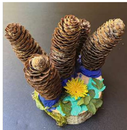
Tannenzapfen mit Holzscheibe