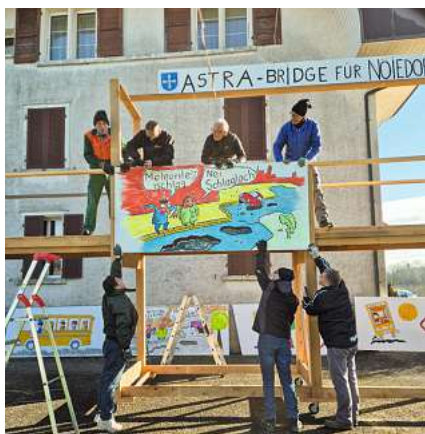
Meteorite-Isschlag? Nei: Schlaglöcher!