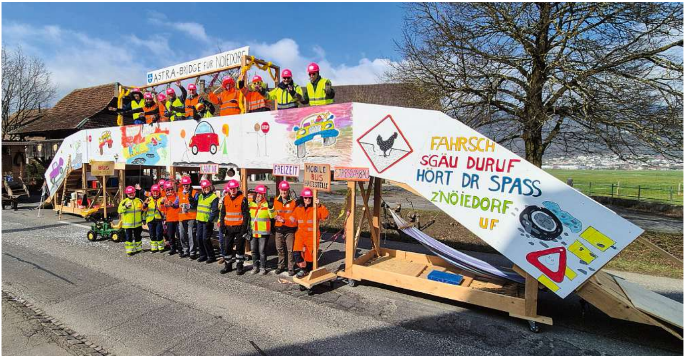
«Wir freuen uns riesig auf den Umzug.»