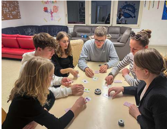
Gruppenstunde – Konzentration herrscht.