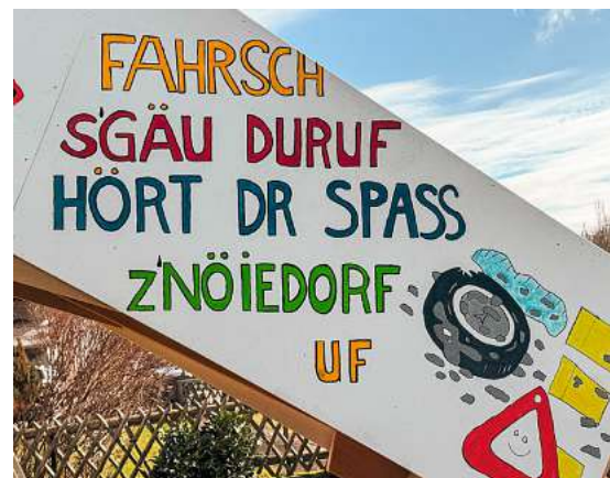
«Jo, das esch tatsächlich so!»