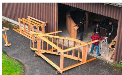
Bald werden diese einzelnen Teile zu einem Ganzen zusammengefügt.