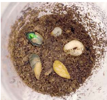
Lebensstadien des Japankäfers.

Die EWG wird umgehend darüber informieren, sollten wir weitere Informationen erhalten.