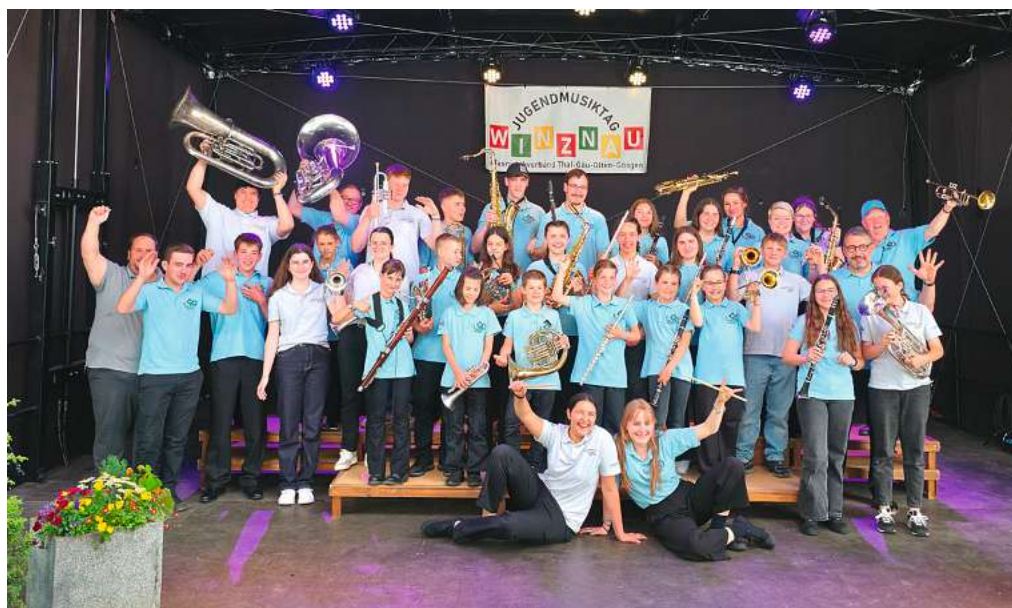
Jugendmusik-Projekt «Jugendmusik Härkingen-Neuendorf und Jugendmusik Untergäu» anlässlich des Jugendmusiktags in Winznau vom 24. Mai 2025.