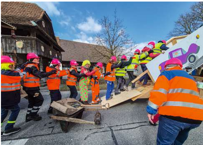
Vorher jedoch ist eine Polonaise über die Brücke angesagt.