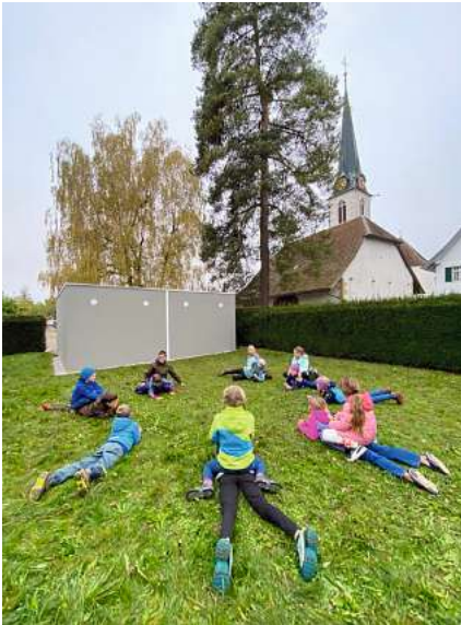
Gruppenstunde – spielerisch ging es hier zu und her.