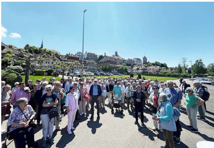
Gruppenfoto in Murten.

Die Kultur- und Sportkommission blickt auf einen gelungenen Tag zurück und freut sich bereits darauf, auch im nächsten Jahr wieder eine so grosse und fröhliche Gruppe von Seniorinnen und Senioren bei einer neuen Reise begrüssen zu dürfen.