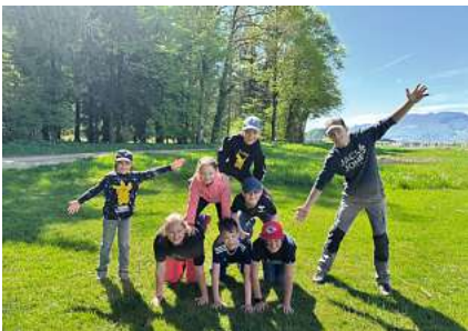
Frühlingscharanlass – wir stützen uns gegenseitig, nicht nur wenns ums Gleichgewicht geht ;)