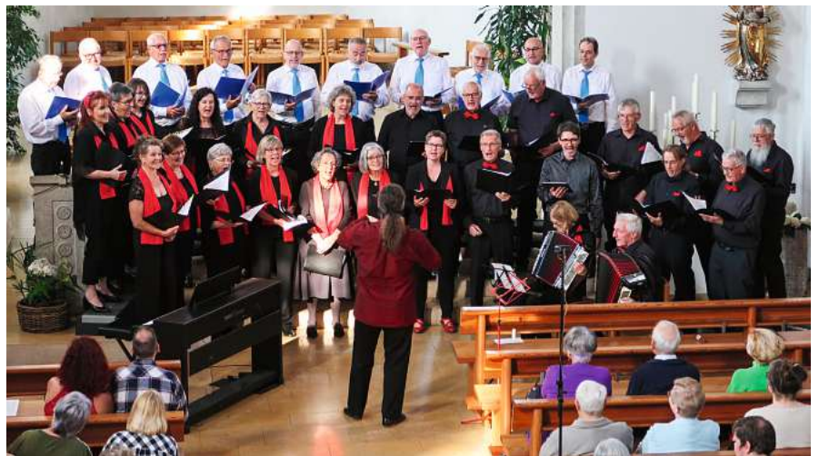
Fulminantes Finale mit dem Ohrwurm «Aus was bruchsch uf dr Wält das isch Liebi».