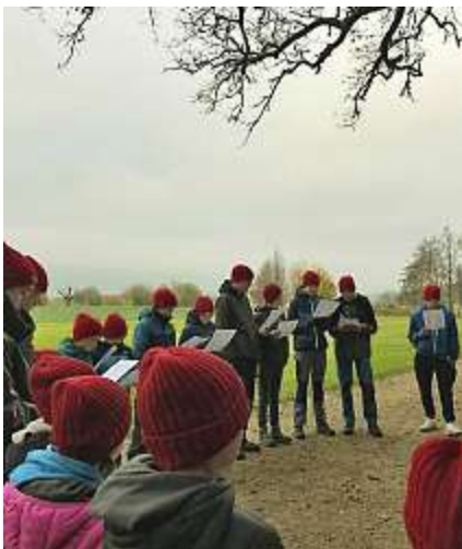
Angelforce – Singen will geübt sein. ;)