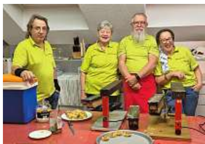
Wir sind bereit, es kann losgehen.