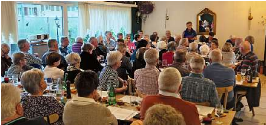
Aufmerksame Zuhörende während der GV.