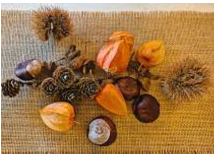
Ein Dankeschön dem Deko-Team.