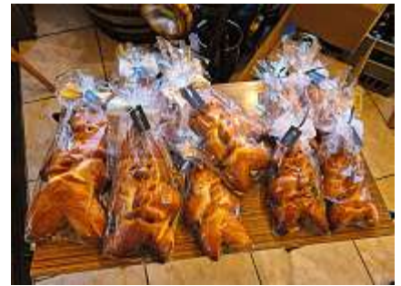
Warten auf glückliche GewinnerInnen.