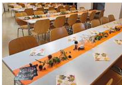
Die herbstliche Dekoration passt.

Nachdem sich die letzten Gäste verabschiedet hatten, konnte aufgeräumt und das Lokal für den Anlass am nächsten Tag bereitgestellt werden.