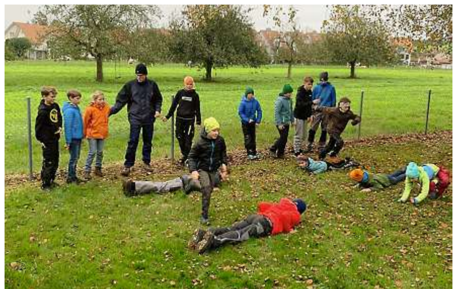
Herbstscharanlass – Wer wohl schneller war?