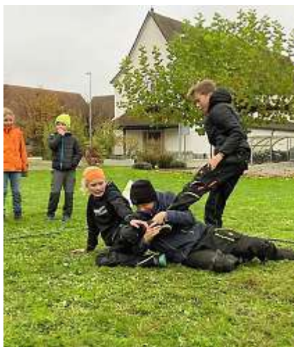
Herbstscharanlass – «Rühr den Winter raus».

Unser Scharjahr startete mit einem Streit zwischen den vier Jahreszeiten. Um zu klären, welches die beste Jahreszeit sei, veranstalteten wir eine Olympiade. Bei dieser wurde jede Jahreszeit durch eine Gruppe Kinder der Jubla Neuendorf unterstützt. In verschiedenen Spielen wurden anschliessend die Kräfte gemessen, so etwa in einem «Loubhuufeboue» oder «Rühr den Winter raus». Es blieb bis zum Schluss spannend. Schlussendlich durfte sich das Team Winter als Gewinner der Jahreszeiten-Olympiade bezeichnen.