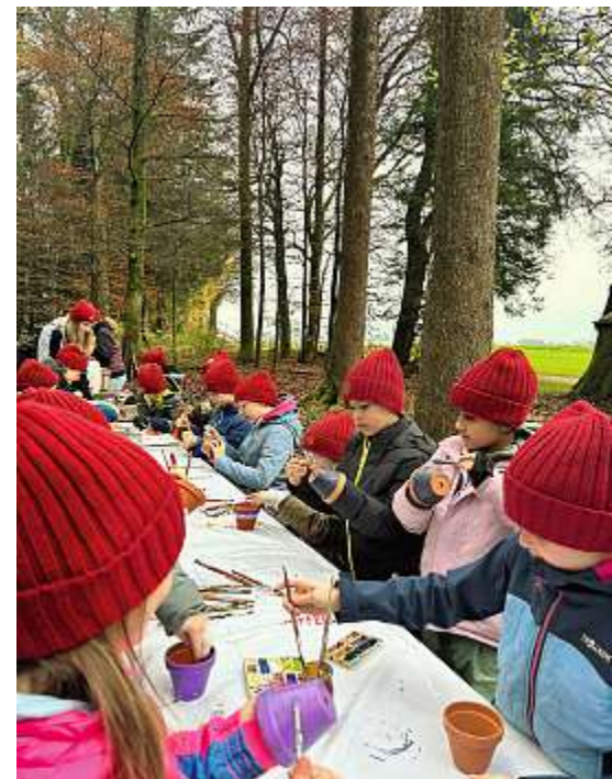
Angelforce – Blumentöpfe bemalen.

Auch dieses Jahr haben wir uns gemeinsam am Projekt «Angelforce» beteiligt. Um unseren Mitmenschen etwas Gutes zu tun, haben wir für sie einen blumigen Gruss gestaltet. Dafür haben wir kleine Blumentöpfe bemalt und diese mit Erde und Pflanzensamen befüllt. Am anschliessenden Gottesdienst haben wir die Blumentöpfe dann verschenkt. Den Gottesdienst durften wir zusätzlich mit eingeübten Liedern musikalisch untermalen. Abschliessend haben wir mit einer Suppe den Herbstabend gemeinsam ausklingen lassen.