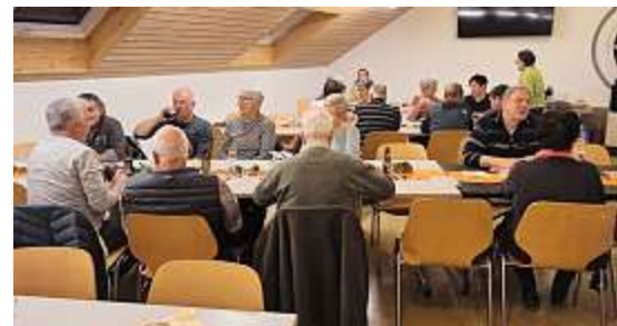
Am Mittag und am Abend durften wir erfreulicherweise eine grosse Gästeschar bewirten.

Die Rückmeldungen der Gäste waren einhellig: Das war ein super Anlass! Das müsst ihr wieder machen! Die Botschaft ist angekommen. Allerdings besteht noch Optimierungspotenzial. Ein herzliches Dankeschön allen Gästen und allen Helferinnen und Helfern. Mit diesem Anlass haben wir Neuland betreten. Es hat sich gelohnt.