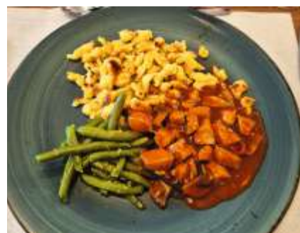
Das Hardeck-Team verwöhnte uns kulinarisch.

«Gstürm im Stägehuus». Während zweier Stunden wurden die Lachmuskeln der 200 Anwesenden strapaziert. Ein grossartiges Theaterstück, hervorragend inszeniert und umgesetzt. Mit der Reise an den Schwarzsee folgte im August ein weiteres Highlight. Dieser jährlich stattfindende Programmpunkt