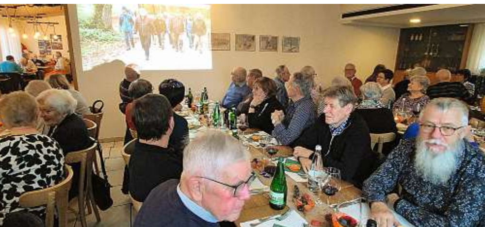
Mit Bildern das Jahr Revue passieren lassen.

«Gstürm im Stägehuus». Während zweier Stunden wurden die Lachmuskeln der 200 Anwesenden strapaziert. Ein grossartiges Theaterstück, hervorragend inszeniert und umgesetzt. Mit der Reise an den Schwarzsee folgte im August ein weiteres Highlight. Dieser jährlich stattfindende Programmpunkt