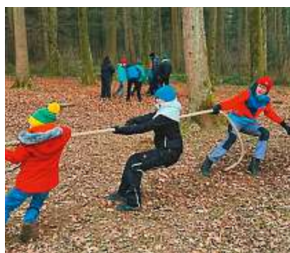
Winterscharanlass – Kräftemessen beim Seilziehen.