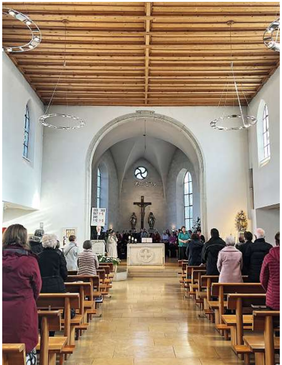
Woche der Einheit.