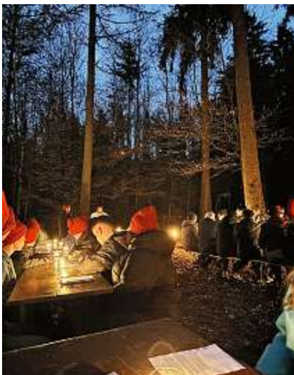
Angelforce – Waldgottesdienst.