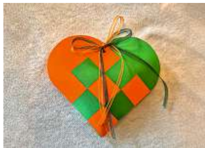
Selbst gebastelte Deko-Herzen mit köstlichem Inhalt.