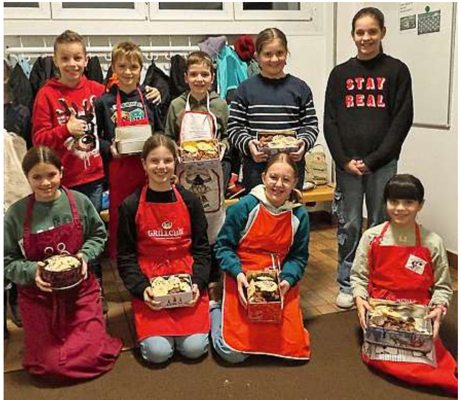
Gruppenstunde 5./6. Klasse – in der Weihnachtsbäckerei.