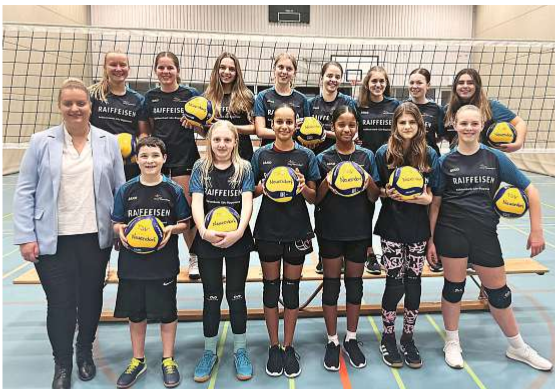
Sponsoren VB Jugend.

Nach einem zweiten Anlauf entschied sich das Team schliesslich für ein Trikotmodell der Marke «Erima». Das neue Design überzeugte sowohl durch die Passform als auch durch die Qualität des Materials. Das ganze Team war erleichtert, dass wir nun ein Modell gefunden hatten, das den Vorstellungen entsprach und mit dem wir in den kommenden Jahren gut spielen konnten. Die letzte Herausforderung stellte die Wahl der Farbe dar. Zunächst war die Idee, die neuen Trikots an den